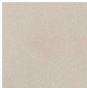
RIVESTI- MENTO DEL PADIGLIONE