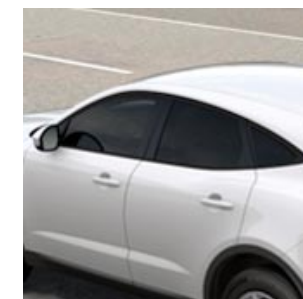
CORNICI DEI FINESTRINI